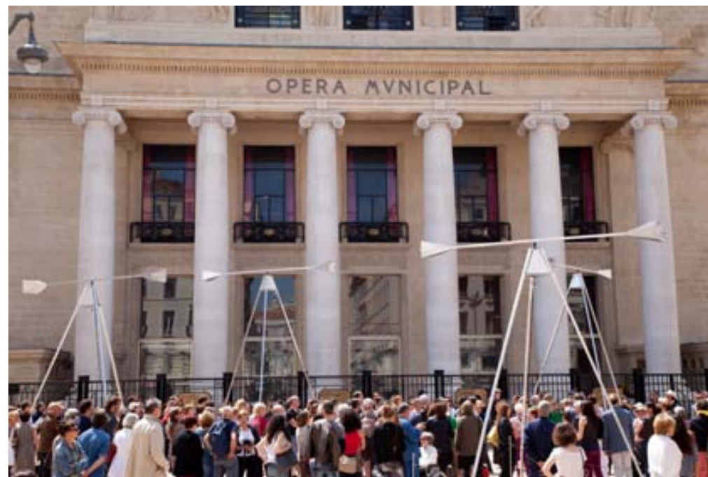
Sirènes et midi net, Chorus, Ray Lee, mercredi 5 juin 2013

Avec le soutien de Marseille-Provence 2013, Capitale européenne de la culture.